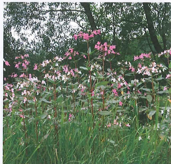
Jättebalsaminen är en av de växter som ska hanteras med stor försiktighet.